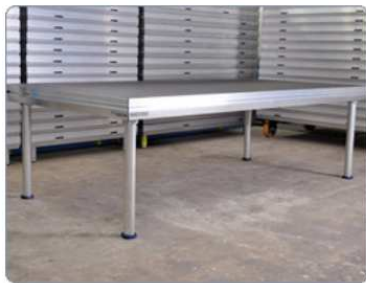
první pódium: 4 nohy jazýčkový profil: zadní a pravá strana