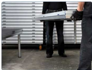
pravá strana dalších pódíí: 2 nohy