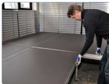
zaháknutí jazýčkového profilu