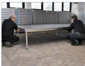
uzamčení spojení na obou stranách