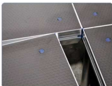
přítlačení pódíí do sebe a zapadnutí do profilu