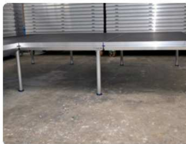
pravá strana: 3 m = 3 pódia = 8 nohou