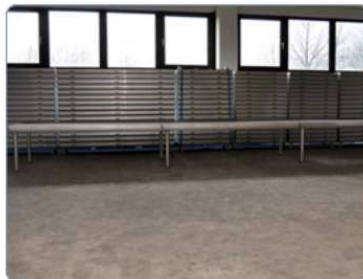
zadní řada 6m = 3 pódia = 8 nohou