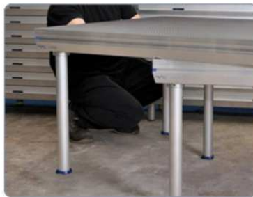
zadní řada dalších pódíí: 2 nohy