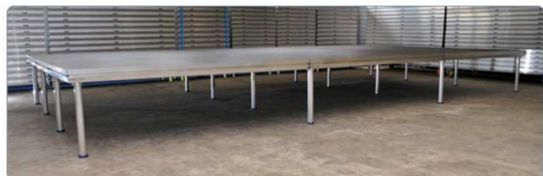
9 pódíí = 16 nohou