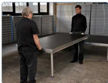
další pódia: 1 noha